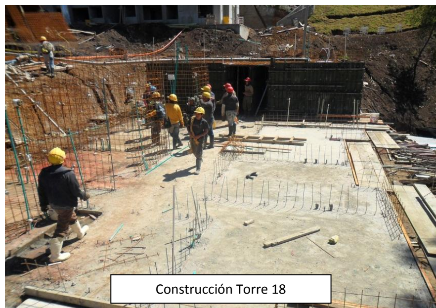
Construcción Torre 18