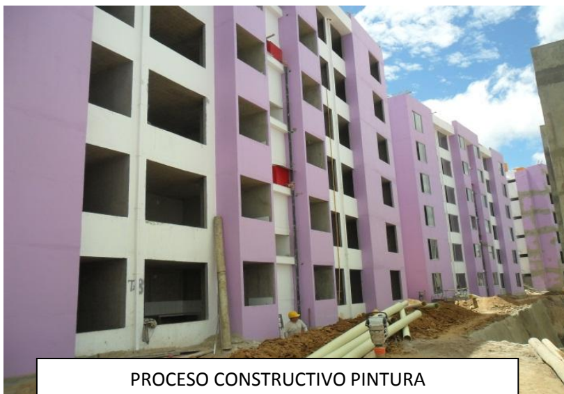
PROCESO CONSTRUCTIVO PINTURA