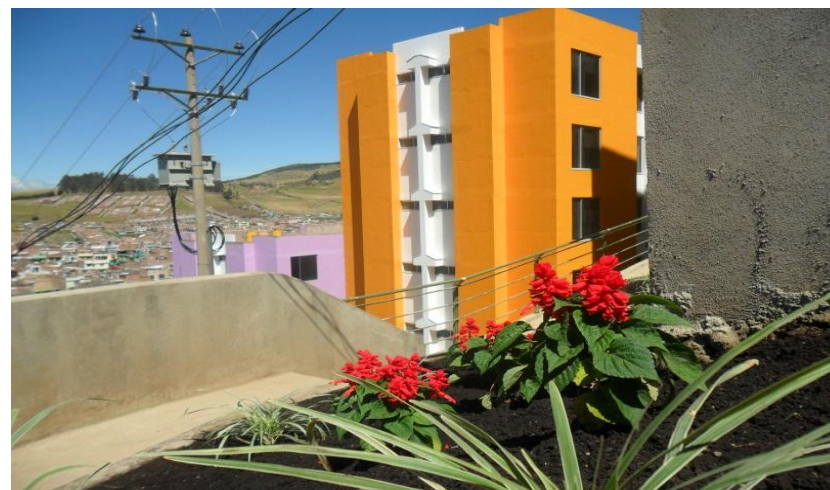
Obras de Urbanismo