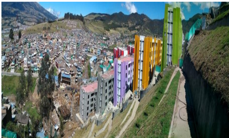
Panorámica del Proyecto