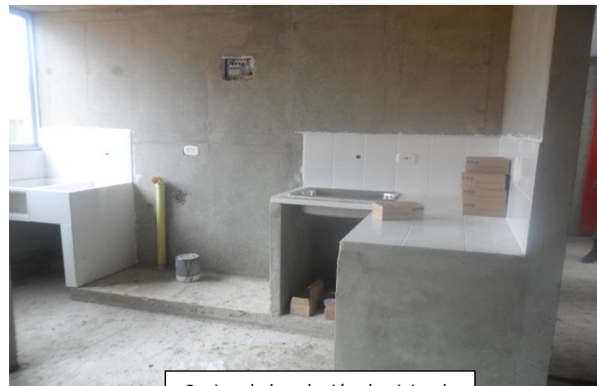
Cocina de la solución de vivienda