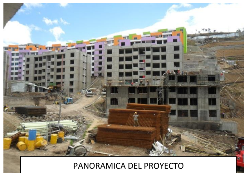
PANORAMICA DEL PROYECTO