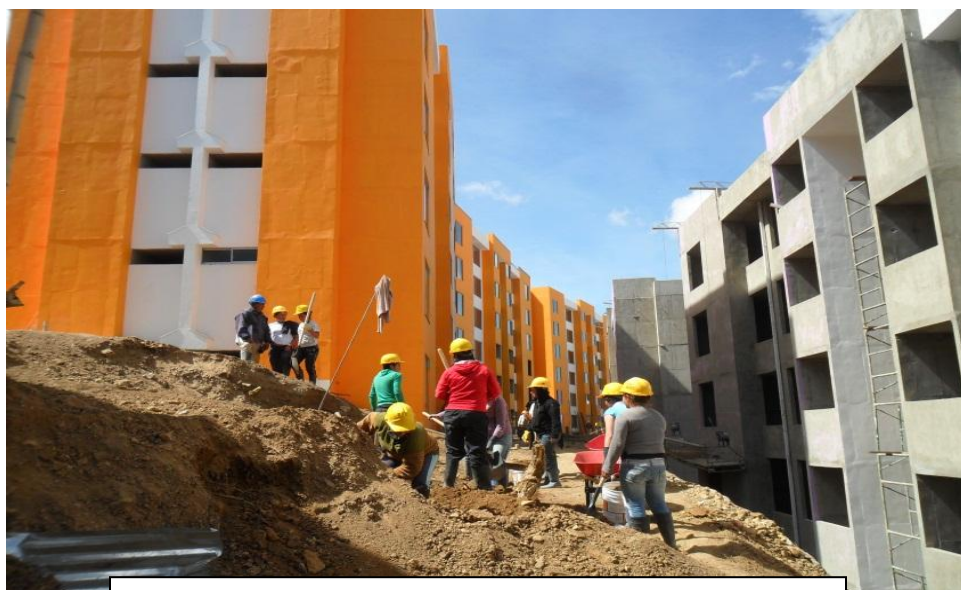
Proceso Constructivo Adecuación de Andenes