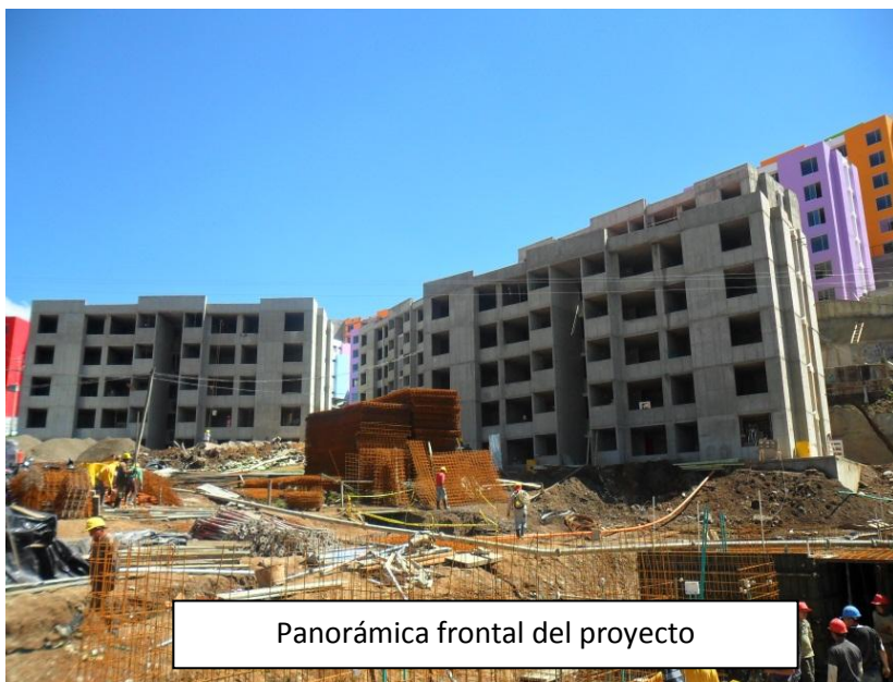
Panorámica frontal del proyecto